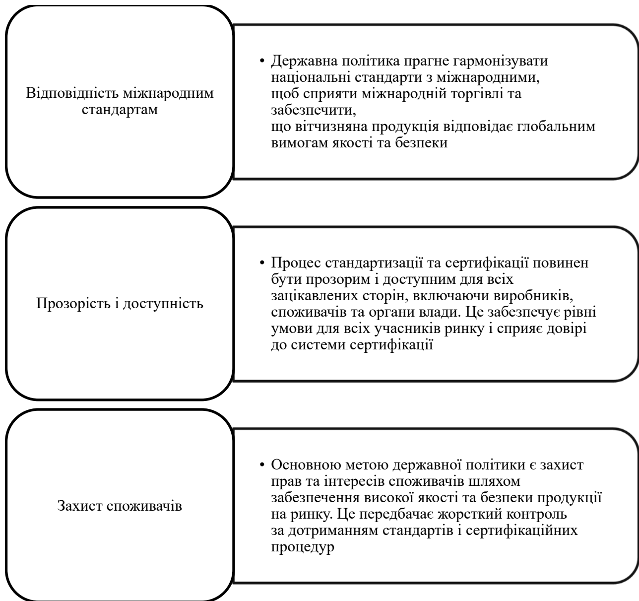
Рис. 2. Державна політика формування системи контролю за дотриманням вимог стандартизації й сертифікації продукції