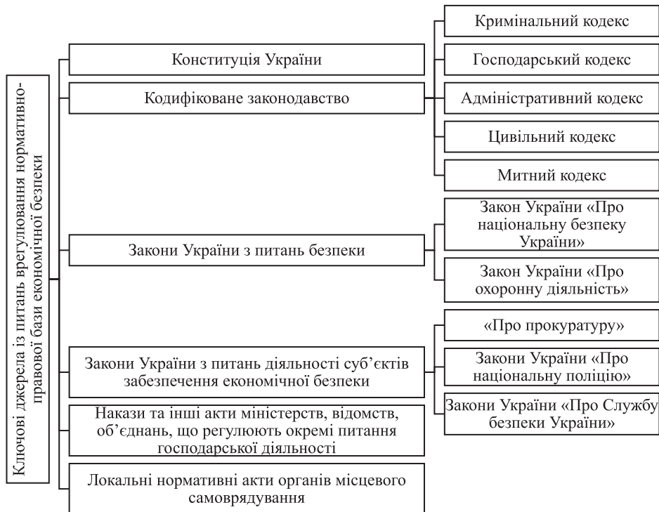
Рис. 3. Ключові джерела із питань врегулювання нормативно-правової бази економічної безпеки