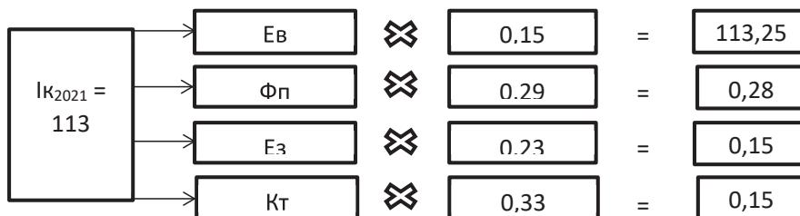
Рис. 1. Схема формування інтегрального показника конкурентоспроможності за 2021 рік