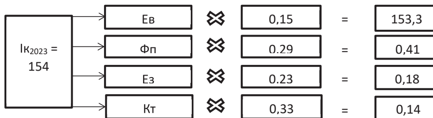
Рис. 3. Схема формування інтегрального показника конкурентоспроможності за 2023 рік