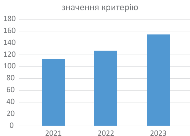
Рис. 4. Динаміка інтегрального показника конкурентоспроможності підприємства

Висновки. На основі аналізування фінансово-економічної діяльності підприємства ПрАТ «Київстар», визначено, що підприємство покращило свою діяльність, зокрема, порівнюючи показники за 2023 р. порівняно з 2022 р., результати збільшення таких показників як: чистий дохід від реалізації (товарів, робіт, послуг), фінансовий результат до оподаткування, величина чистого прибутку, та інші, але наприклад, чистий дохід від реалізації продукції у 2023 збільшився на 4605898 тис. грн (16,12 %) що є позитивним у діяльності підприємства, а в 2023 році порівняно з 2021 роком фінансовий результат до оподаткування зменшився на 1177539 тис. грн (8,34 %), чистий прибуток зменшився на 724336 тис. грн (6,42 %), також фінансовий результат від операційної діяльності зменшився на 837980 тис. грн (5,61 %). Водночас вартість майна підприємства збільшилась на 16982136 тис. грн (59,78 %) за рахунок як основного, так і оборотного капіталу, що свідчить про розширення діяльності підприємства. Платоспроможність підприємства покращилась, про що свідчить збільшення коефіцієнта покриття на 258,6 %, тобто в 4 рази більше порівняно з 2021 роком, значення показника в 1,65 у 2023 році вказує про достатню наявність оборотних активів на підприємстві