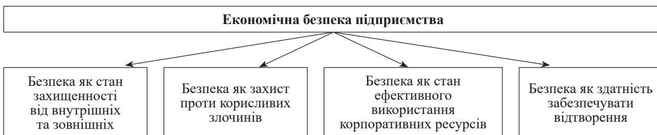
Рис. 1. Підходи до визначення поняття «економічна безпека підприємства»

У межах другого (якісного) підходу, економічну безпеку трактують як ключову якісну характеристику економічної системи, що визначає її здатність підтримувати нормальні умови для функціонування і розвитку основних учасників: держави, бізнесу та громадян. Зокрема, Я. Жаліло зазначає, що поняття «економічна безпека» є складною багатофакторною категорією, що визначає здатність національної економіки до розширеного