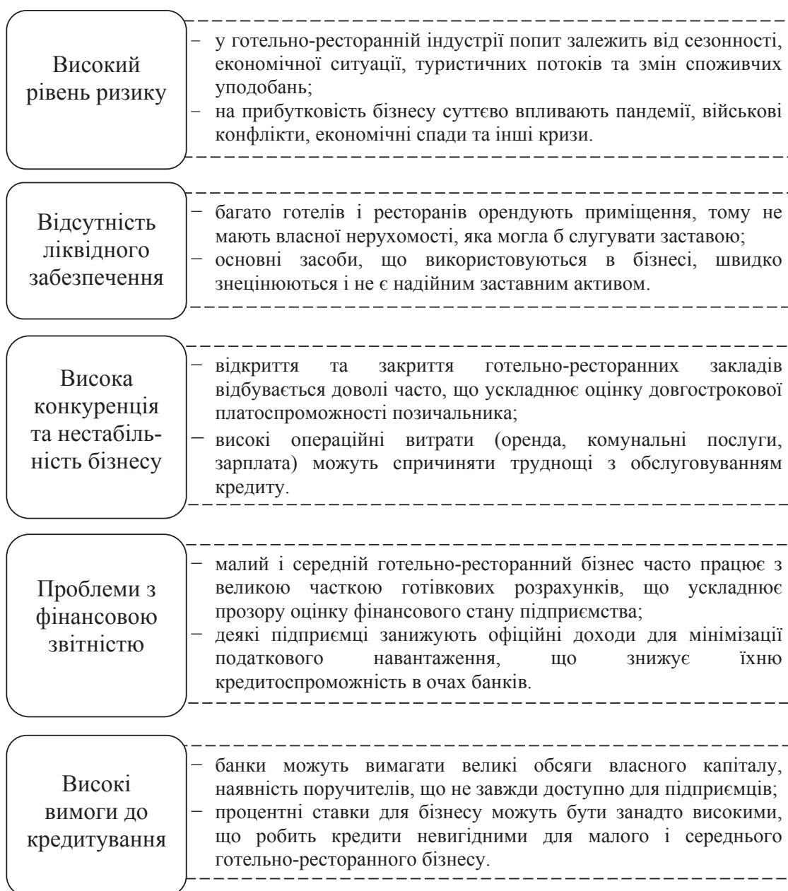
Рис. 2. Чинники, які стримують банківське кредитування готельно-ресторанного бізнесу

Готельно-ресторанний бізнес вважається ризикованим через високу конкуренцію, нестабільні доходи та відсутність достатнього заставного майна. Це змушує банки або відмовляти в кредитуванні, або висувати жорсткі умови, що обмежує доступ підприємств готельно-ресторанного бізнесу до фінансування.