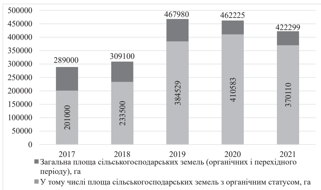
Рис. 1. Динаміка земельної площі України під органічне землеробство

Розвиток органічного виробництва в Україні стримується певними чинниками, такі як [2, с. 165–166; 3, с. 83]: низька купівельна