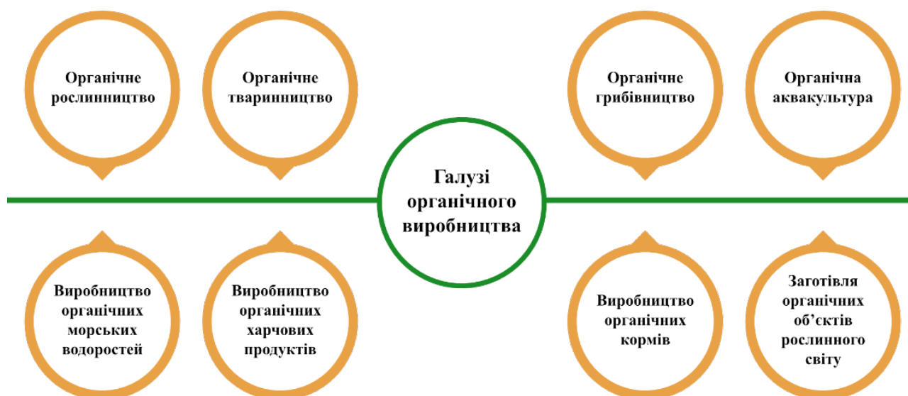
Рис. 1. Галузі органічного виробництва